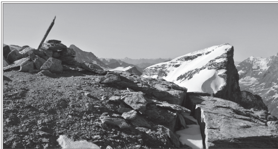
Dall'alto 1): Il bivacco des pantalones blancs 2) In primo piano la S Salle, leggermente dietro il Pleureur. Sulla sx la Luette e il Mont Blanc de Cheillon 3) Il Pleureur dalla cima della Salle